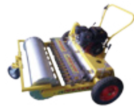
JAS-1400C (양파용, 14조식) (for onions, 14-rows)