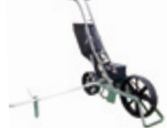
1001-B (엽채류, 콩·옥수수용, 수동1조식) (for vegetables, beans & corns, 1-row)