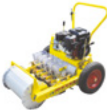
JAS-502C (엽채류용, 5조식) (for vegetables, 5-rows)