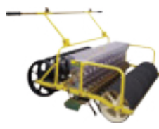
JP-13WG (인삼파종기용, 수동13조식) (for ginsengs, 13-rows)