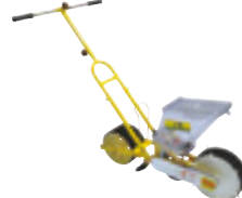
JD-1 (콩·옥수수용, 수동1조식) (for beans & corns, 1-row)