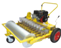
JAS-1000C (엽채류용, 10조식) (for vegetables, 10-rows)