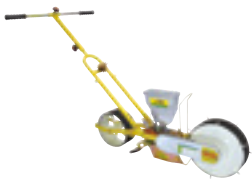
JP-1 (엽채류용, 수동1조식) (for vegetables, 1-row)