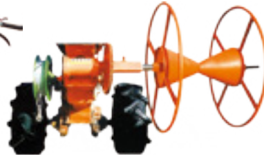
DH-K900 경운기 부착형 (비닐 및 보온덮게수거기)