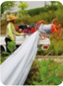
DH-C90/180 차량용 (엔진부착 유압식)