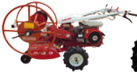
DH-G600 관리기 부착형 (비닐 및 보온덮게수거기)