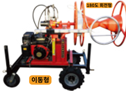
DH-C90/180 동력비닐수거기 (엔진부착 유압식)