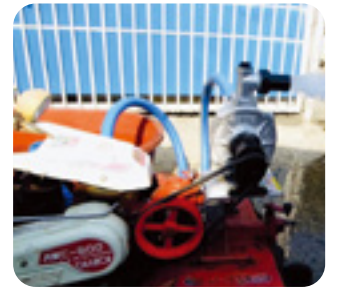
관리기 부착형 만능취부대 (특허품)