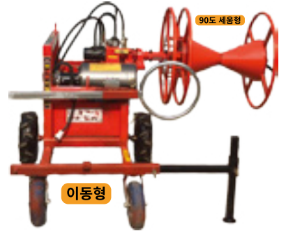
DH-C90/180 동력비닐수거기 (전동모터유압식)