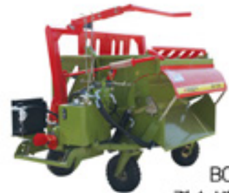
BC-150 결속 벧짚절단기