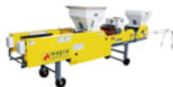
VE-31 대파 파종기