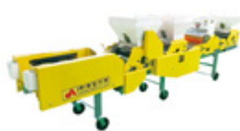
OSE-12KR 양파 파종기