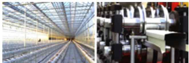
▲ 생산 제품 및 장비