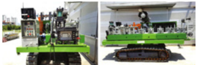
▲ 이동식 포밍장치