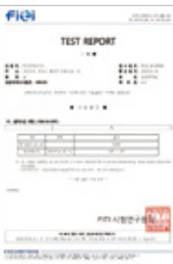
원적외선 방출 실험